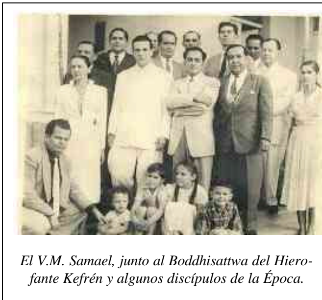
El V.M. Samael, junto al Boddhisattwa del Hierofante Kefrén y algunos discípulos de la Época.

Cuando el ser humano ha conquistado en su existencia Dharma, o sea capital cósmico, como haberse sacrificado por la humanidad, los Maestros de Com-